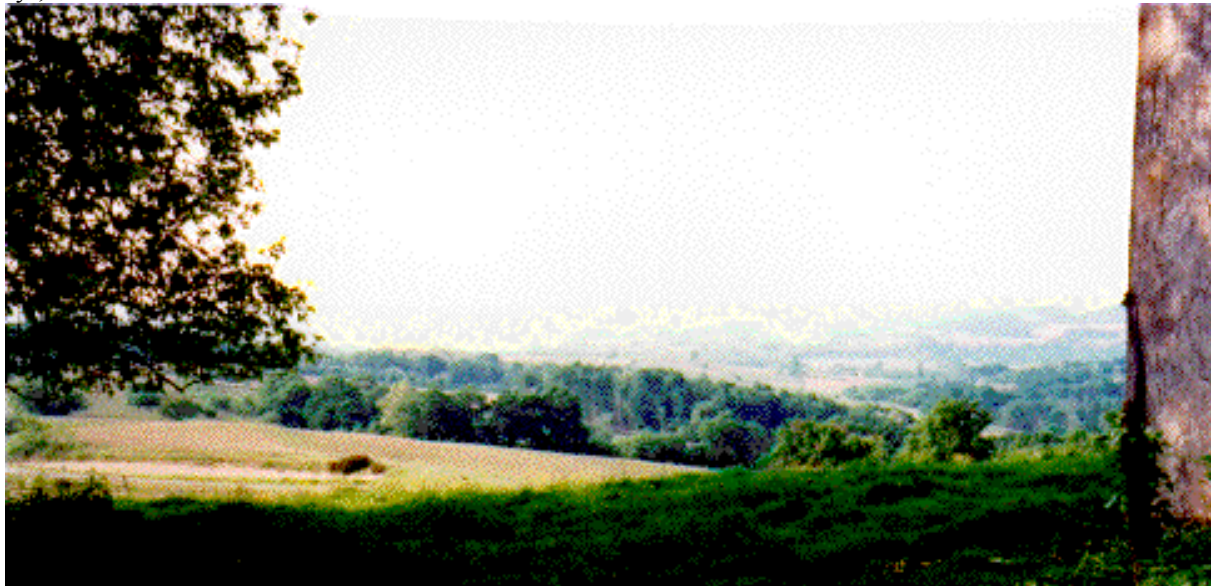
Site du Pabaâ, côté Nord. On distingue à droite le mur de la grange

Salies-de-Béarn, ville thermale, est connue pour l'exploitation du sel depuis le Moyen-Age. Sur les rives du Saleys, maisons du XVI ème siècle.