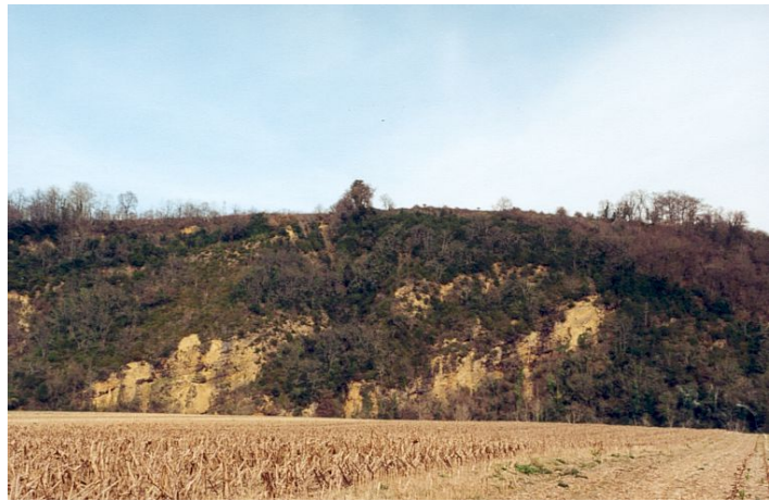
Le Pène de Mûr, face Ouest.